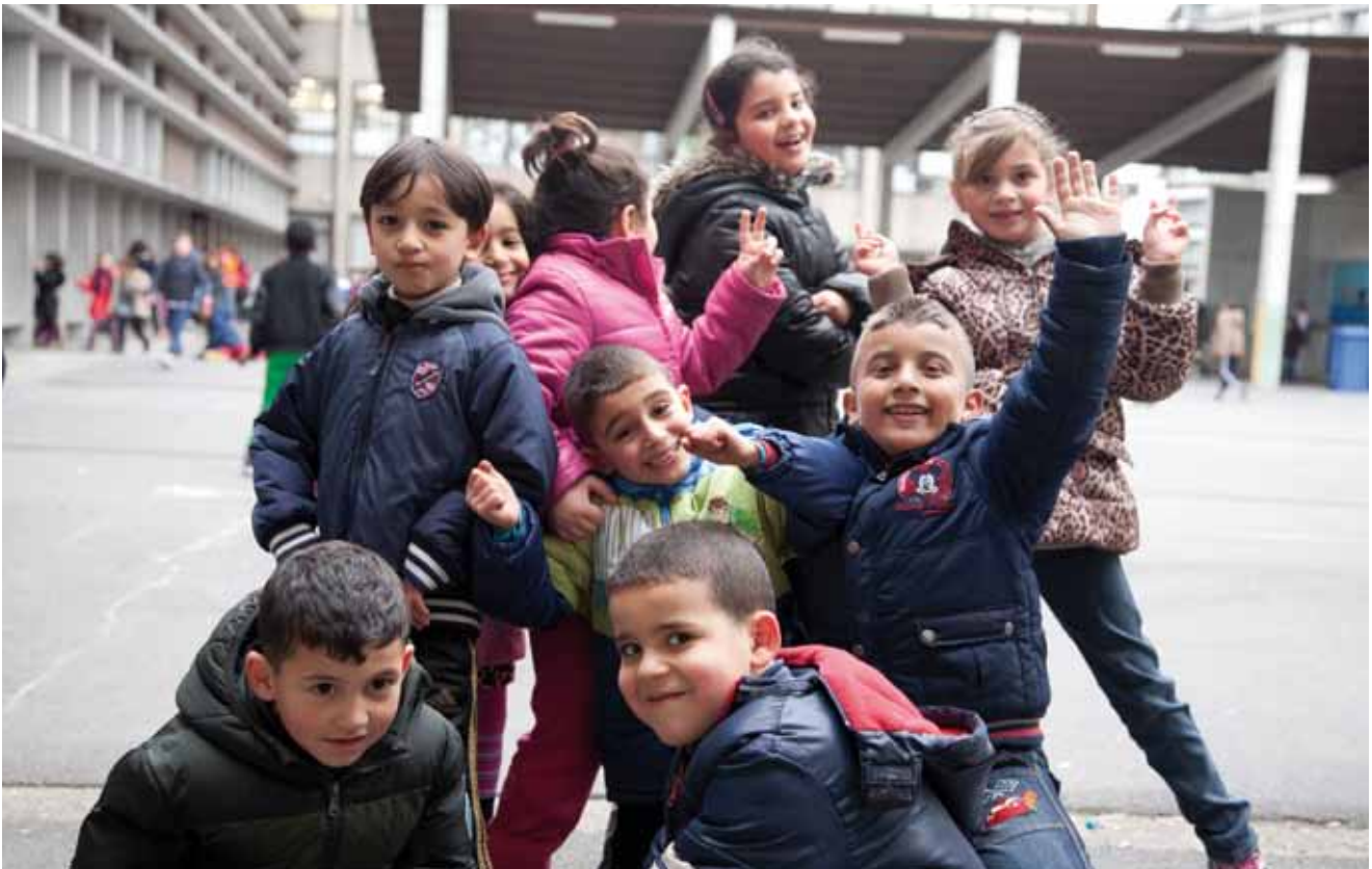
De Brusselse ketjes verdienen het dat we de lat hoog leggen (basisschool 't Klavertje 4, Brussel).

In het Brusselse onderwijs liggen de uitdagingen voor het rapen. Er is werk aan de winkel en wie van de stad, de bewoners en de leerlingen houdt, ziet daar niet tegen op. Integendeel, meertaligheid, omgaan met kansarmoede, hyperdiversiteit ..., het zijn allemaal elementen die het werk net urgent en boeiend maken en houden. Aan de slag in Vlaanderen? 'Nee, we zoeken de uitdaging en worden almaar betere leraren.' Brussel dus, het bruisende onderwijs en al die leerlingen die het verdienen dat hun leerkrachten de lat hoog leggen.