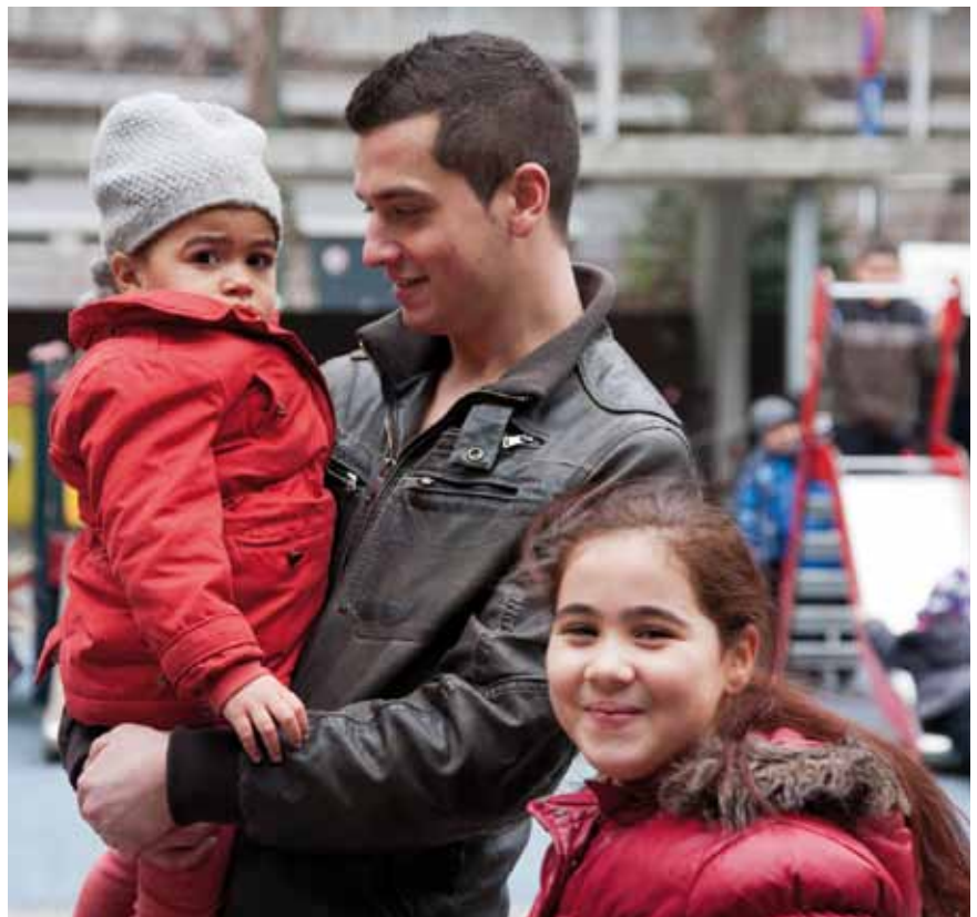
Wetenschappelijke inzichten vertalen in de klaspraktijk is een intensief proces.