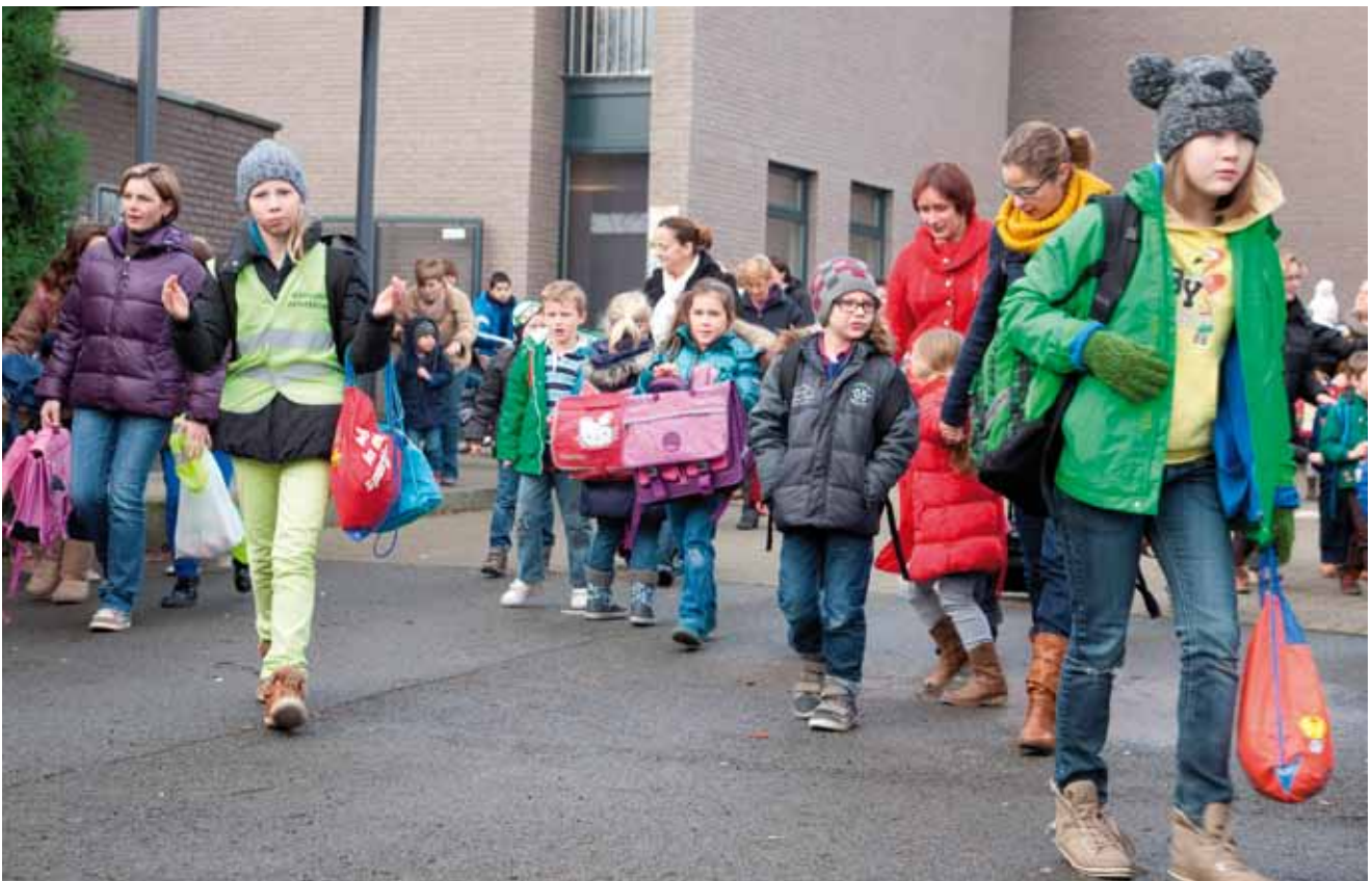
OVSG vraagt een gelijke financiering voor het kleuteronderwijs.

OVSG vraagt initiatiefrecht voor basisonderwijs en deeltijds kunstonderwijs