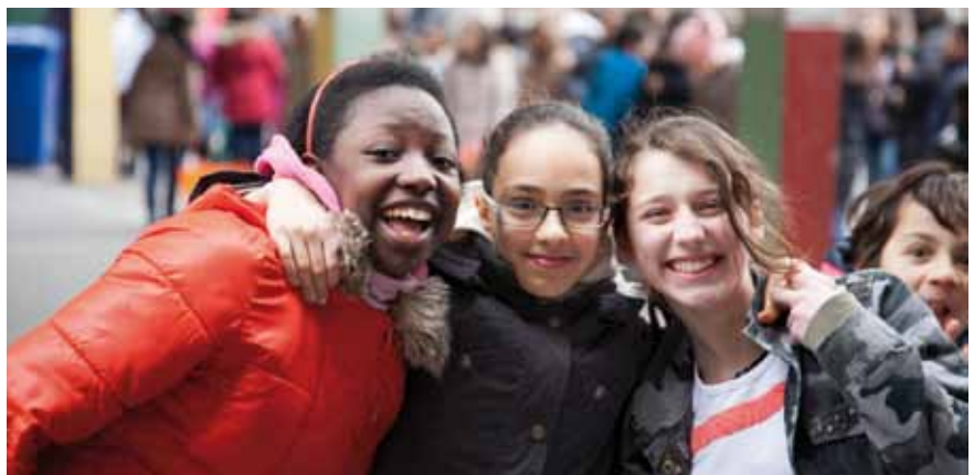
Ook in 't Klavertje 4 zijn taalachterstand wegwerken en ontwikkelingskansen maximaliseren prioritair.

'Onze school ligt in de noordwijk van hartje Brussel. 't Klavertje 4 weerspiegelt de buurt: een overwegend allochtone populatie met een grote diversiteit aan culturen, waarbij er ook veel