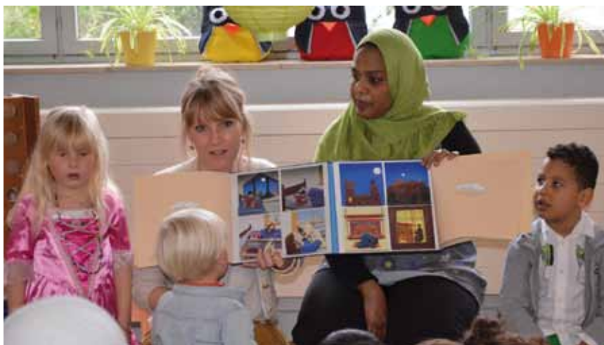
Meertalig sprookjesbuffet.

'Uit onderzoek blijkt dat een goede beheersing van de moedertaal een belangrijke factor is in de leerontwikkeling van kinderen. Respect voor de thuistaal krijgt daarom een prominente plaats in ons talenbeleid. Onze openheid voor meertaligheid gaat hand in hand met wederzijds respect. Concreet betekent dit dat alle ouders en kinderen aan de schoolpoort in het Nederlands begroet worden en er wordt ook een Nederlandse groet terug verwacht. Op activiteiten met de ouders zoals infovergaderingen, praatcafés, koffiemomenten en openklasdagen is de voertaal Nederlands. Toch